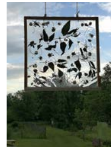
Sans titre © Antoine Ordonnaux, 2018