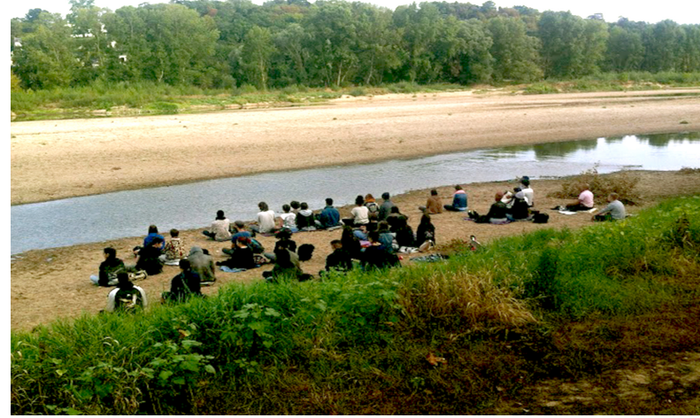
expérience n°7 bord de Loire L1