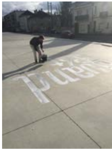
Action dans le contexte du cours de Bruno Saulay, Audioportrait